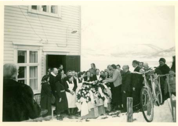
Gamlehjemmet et møtested for bygda folk. Her ved begravelse.

De frivillige organisasjonenes rolle i velferdssektoren har vært betydelig, men var frem til 1990 omtrent fraværende både i den omfattende litteraturen om velferdsstatens utvikling og i den nasjonale helsepolitikken. Skandinavisk velferdsforskning har etter dette påvist hvordan frivillige og humanitære organisasjoner opprettet mødre hjem, barnehjem, pleiehjem, sykehjem, gamle hjem og tuberkulose hjem i et stort antall. De frivillige organisasjonene var store velferdsprodusenter og de hadde i perioder stor ideologisk innvirkning. De var dessuten mange og de var forskjellige. Det krever et begrepsapparat som fanger inn ulike typer organisasjoner og som kan gi perspektiv og fruktbare analyser i forholdet organisasjon – institusjon – samfunn.